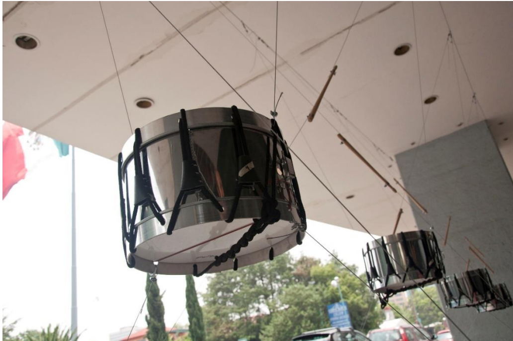
Figura 2. Contención Reglamentaria .

emiten vibraciones (sonidos) cada vez que alguien se acerca. En Contención Reglamentaria (2012), cinco tambores militares están tensados con cables de acero en una línea, una fila militar, así como sus baquetas que nunca logran tocarlos; se encuentran en extrema tensión todavía a la espera de poder hacerlos redoblar. La instalación es además un obstáculo, una especie de valla que nos impide pasar. Esta obra habla del estatismo, de la imposibilidad del movimiento en un país en guerra, no nos podemos mover libremente, estamos atados como en el sistema estático de Prigogine que no produce suficiente energía y causa al final una inercia permanente en la materia (Figura 2).