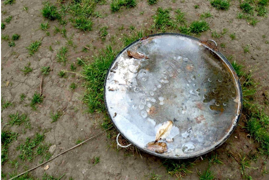
Figura 1. Massa Confusa .

se le llama a la primera fase alquímica en la que se intenta separar distintas sustancias disímiles para sacarlas de su estado amorfo y caótico.