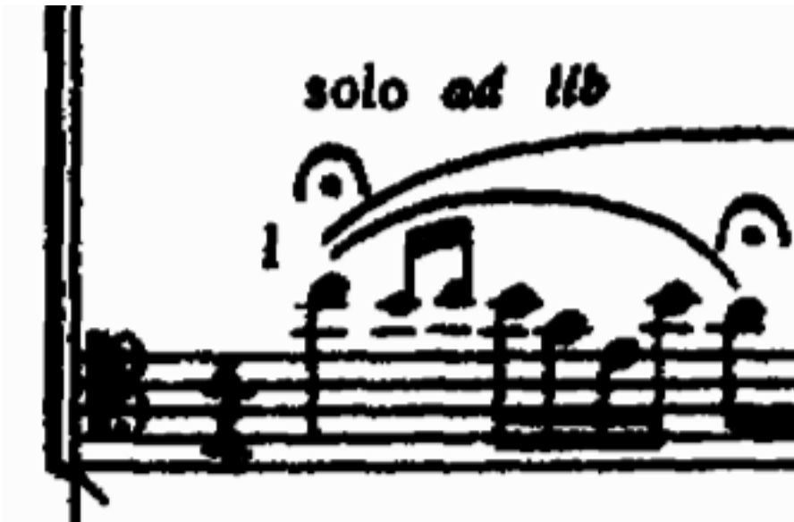
Strawinsky. Solo de fagot del comienzo de la Consagración de la primavera . Partitura

La disección en frecuencias de una señal dada se realiza por medio de un algoritmo conocido como la transformada de Fourier, formulada matemáticamente en 1822. El análisis del sonido dinámico como tal, consistirá, por lo tanto, en una especie de encadenamiento de instantáneas obtenidas mediante la transformada de Fourier, que subyace en el mismo principio que la cinematografía: el efecto Phi, mediante el cual es posible concebir un movimiento por medio de la secuenciación más o menos rápida de instantáneas. Como comentábamos, esta secuenciación de instantáneas requiere de una cuantización mucho más "fina" en el ámbito de lo sonoro que en el de lo visual, con lo que la cantidad de cálculos que es necesario emplear para llevar a cabo tal tarea es enorme; todavía en la