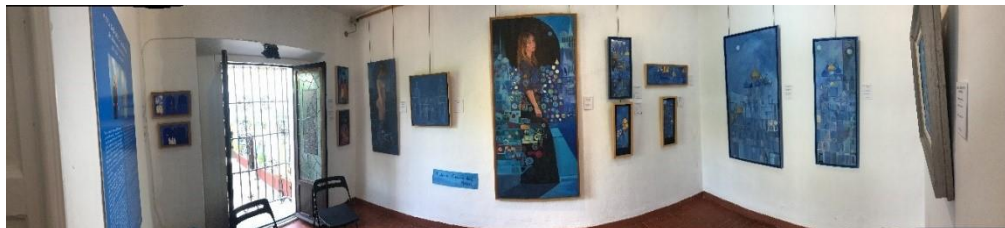
Figura 1. Vista general de la sala Un alma enteramente de la Fundación Amalio. Imagen de elaboración propia.