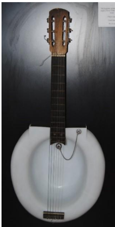
Figura 4. Amalio García del Moral: Guitarra higiénica (1982). Museo de la Fundación Amalio, Sevilla.

Expresionismo de la materia hace referencia a la tercera de las salas de la exposición permanente, así como al tercer movimiento de Sonidos para una exposición . En este número la relación formal entre sala y partitura se hace patente a partir de un conjunto de materiales motívicos de un marcado carácter expresionista que hacen alusión a cada una de las diferentes muestras plásticas que Amalio ofrece de la Giralda. De este modo podemos observar una forma rapsódica en la que se enlazan diversos materiales independientes contruidos, únicamente, a partir de los sonidos re, sol, do, fa, la, como resultado de la transposición de la serie mi, la, re, sol, si. Estos últimos cinco sonidos hacen referencia al orden de las cuerdas de la guitarra –desde la más grave a la más aguda– en relación a la obra La guitarra higiénica (1982) 64 de Amalio, situada, también, en esta sala tal y como vemos en la figura n.º 4.