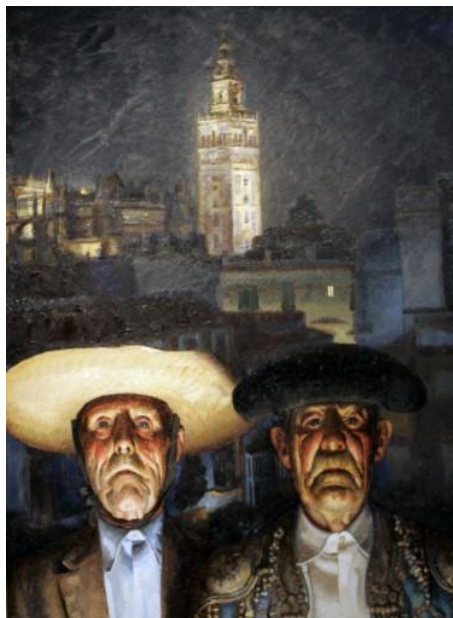
Figura 3. Amalio García del Moral: Sevilla güena (1974). Museo de la Fundación Amalio, Sevilla.

Aquí se utiliza para la composición la traslación de ideas convergentes a partir de distintos trazos pictóricos. Para ello, como ejemplo, podemos citar la intensa e incisiva mirada de los protagonistas del cuadro Sevilla güena (1974) que preside la sala –y que vemos en la figura n.º 3–, la cual se traduce en la partitura a modo de slap . Esta idea surge para realizar una metáfora sonora a partir del golpe visual que dicha mirada produce en el espectador cuando se introduce en esta dependencia del museo.